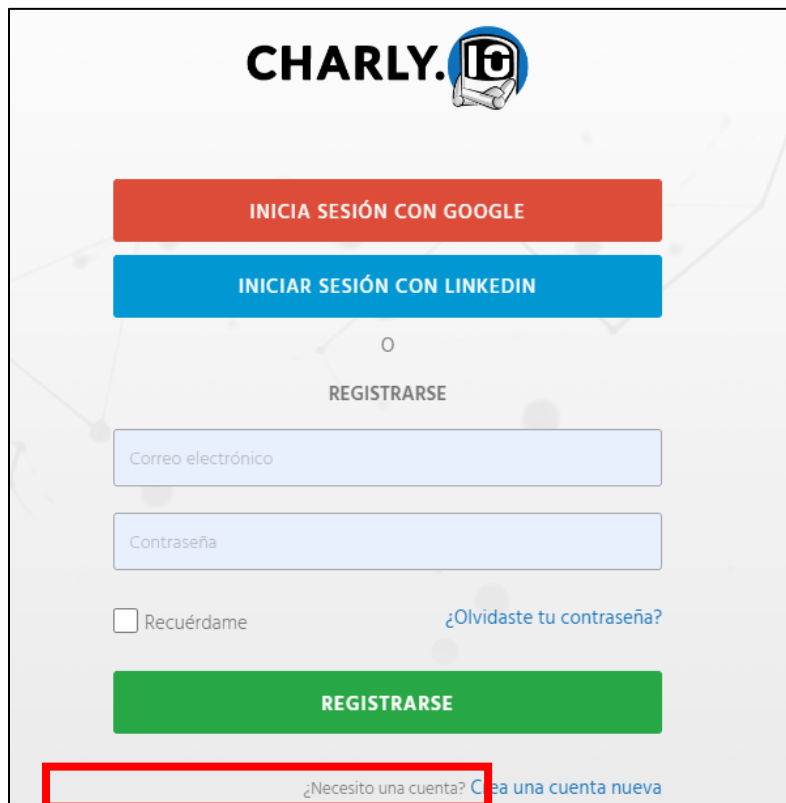
Figura 1. Inicio de Sesión.

El enlace redirecciona a la plataforma Charly.io, en donde se debe iniciar sesión para rellenar el formulario. Como se observa en la Figura 1 , para ello, se puede utilizar una cuenta preexistente de Google, GMAIL o LinkedIn. En caso de no contar con ninguna de estas cuentas, también, se puede crear una cuenta nueva en la parte inferior derecha que se encuentra remarcada en un cuadro de color rojo, con cualquier correo.